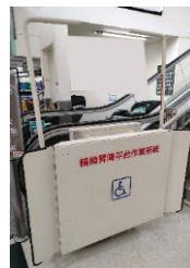
樓梯附掛式 輪椅升降臺