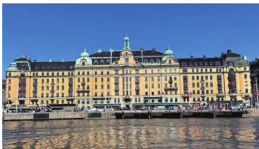
圖1-1 斯德哥爾摩皇宮。