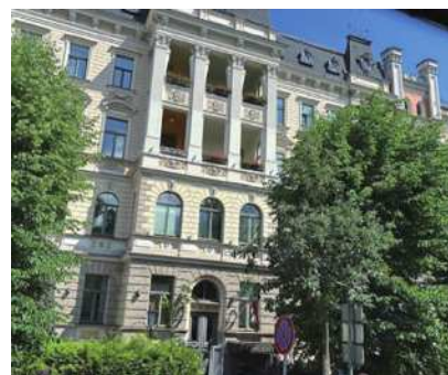
圖4-4 有名的新藝術建築。

規劃和其他的北歐城市很類似，道路廣闊，中間有電車、公車在走，然後旁邊有腳踏車道，最外面就是人行道，沒有看到摩托車，交通秩序良好。四處是公園、綠地、行道樹，都市綠美化做得很好(圖4-1)。