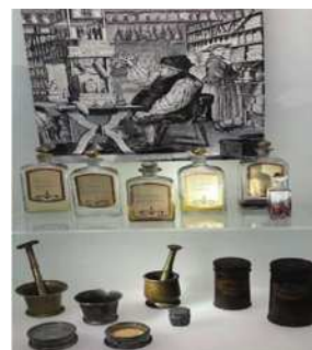
圖5-3 琥珀也可以藥用。