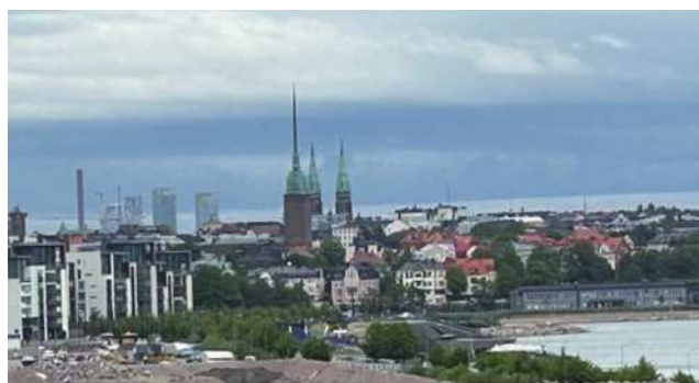
圖3-1 Tallinn新舊交錯的都市景觀。

拿到了緊急護照之後，找交通工具回遊輪又是另外一個考驗！到哪裡去叫計程車呢？領事館的員工建議我們去附近的旅館問問看。果然十分順利，這裡的人都很友善。不到10分鐘，車子就來了，司機按表誠實收費。雖然，這次旅行很不幸的一開始就遺失了護照，本來可能是一場災難，幸好遇到一些貴人幫助。非常感謝船上工作人員和友善樂於助人的Tallinn市民，才能在幾個小時內順利拿到緊急護照。同時，也要感謝同遊的朋友們的代禱和幫忙，使我們這次的旅遊有驚