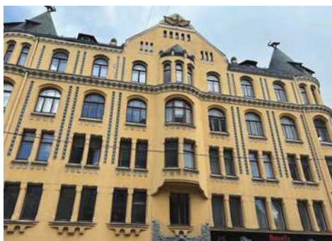
圖4-3 Cat House。