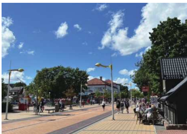
圖5-4 Polanga新開發的觀光景點。