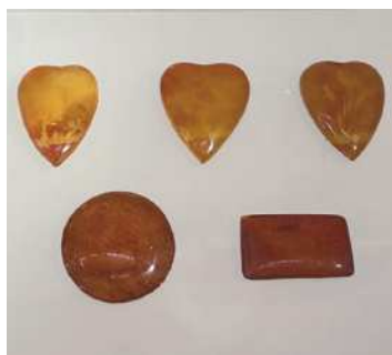
圖5-2 琥珀珠寶裝飾品。