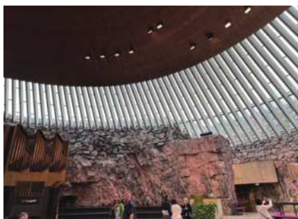
圖2-3 精心設計的巖石教堂。