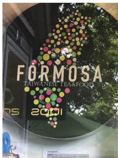
圖5-5 賣台灣珍珠奶茶的店。

遊輪在立陶宛濱臨波羅的海的克萊佩達港靠岸。上岸旅行第一站是來到很出名的琥珀博物館。此博物館本來是一位大戶人家的私人夏宮，附近幅員遼闊，處於森林中，有一個很大的花園，其中，建設此一大宅院(Mansion)(圖5-1)。此大宅院現在就成為琥珀博物館，裡面從琥珀生成、開採、研究、用途以及珠寶產品等，展示琳瑯滿目，算是一個對琥珀收藏很完整的博物館，令人印象深刻(圖5-2, 5-3)。