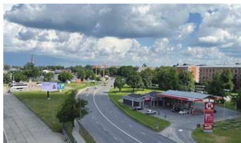
圖4-1 Riga 都市綠美化做得很好。