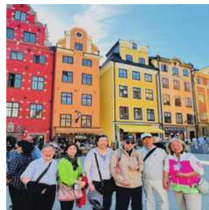
圖1-3 典雅美麗的中世紀建築。