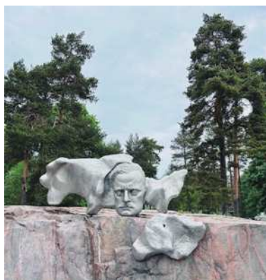
圖2-1 西貝流士紀念公園。