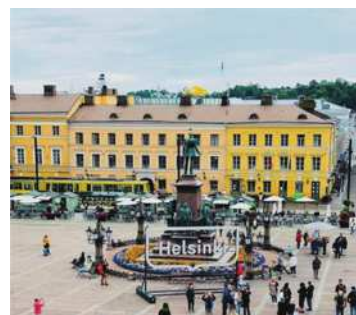
圖2-5 赫爾辛基的中央廣場。

加。啟程後上岸旅遊(shore excursion)，6月6日來到北歐最幸福的國家芬蘭的首都赫爾辛基。