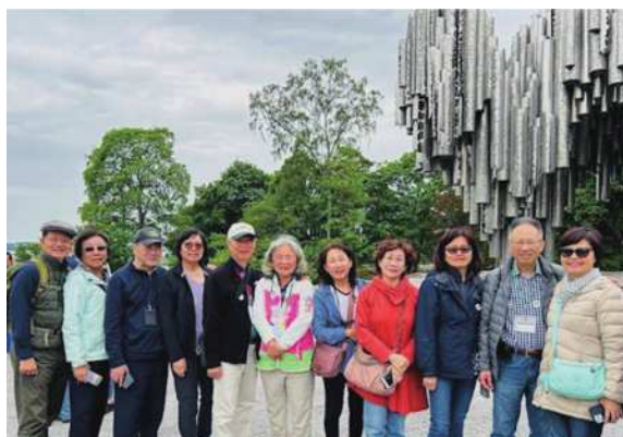
圖2-2 西貝流士紀念公園的管風琴銅雕。