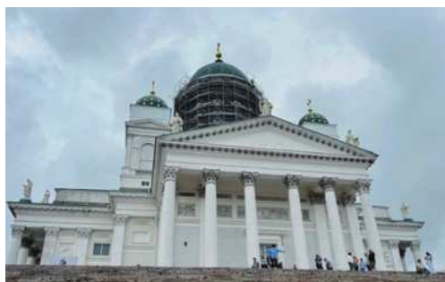
圖2-4 典雅莊嚴的主教座堂。