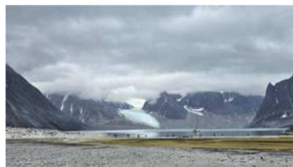
圖3 冰山倒映仿如世外桃源般美麗。