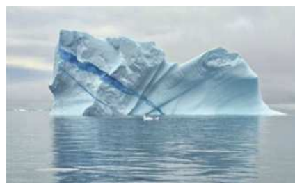
圖18 形狀變化萬千的絕世美景。