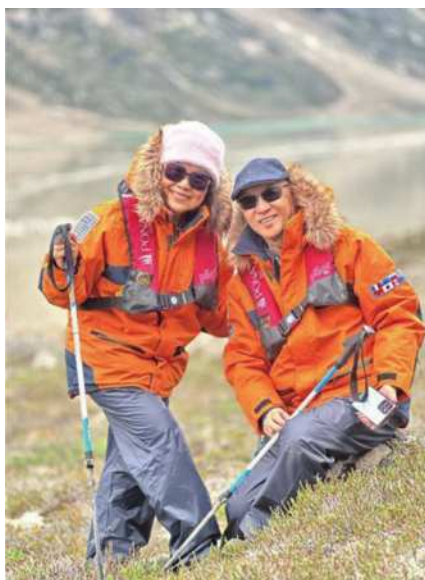
圖17 拄著登山杖進行極地徒步。