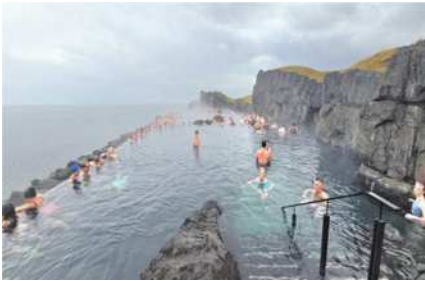
圖34 Sky lagoon無邊際海景地熱溫泉。