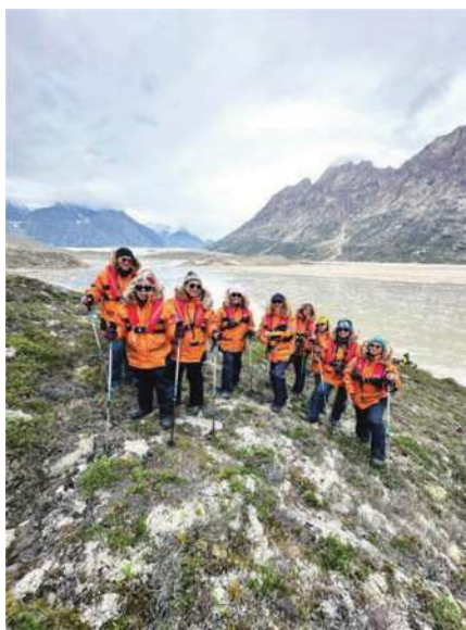
圖16 在格陵蘭的第一次濕登陸。