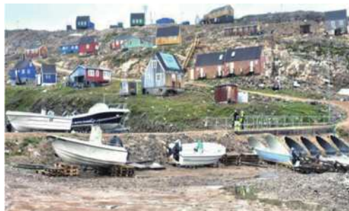
圖26 伊托科托米特村落。