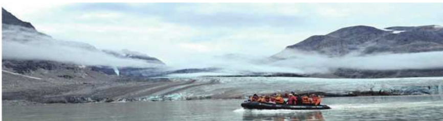
圖22 冰川之美令人嘆為觀止。