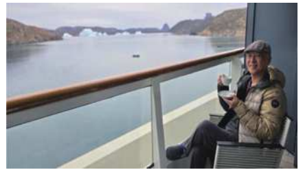
圖13 邊喝咖啡邊欣賞美麗的冰山群。