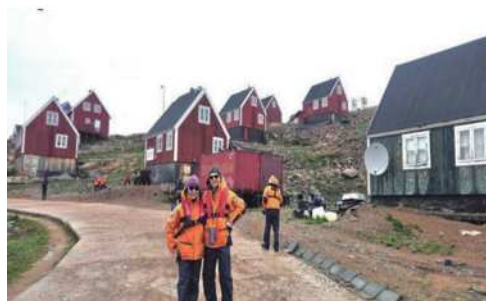
圖27 別具特色的繽紛小木屋。