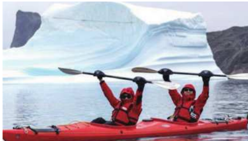
圖14 雙人獨木舟初體驗。