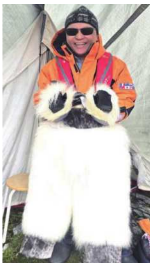
圖28 暖和的北極熊毛皮衣褲。