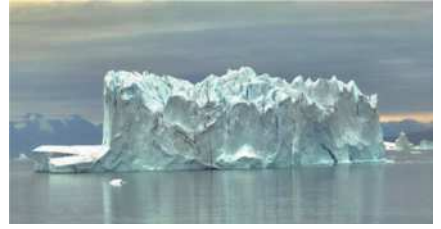
圖10 大大小小的冰山給予許多想像空間。