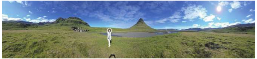
圖35 廣闊無垠的冰島風光。