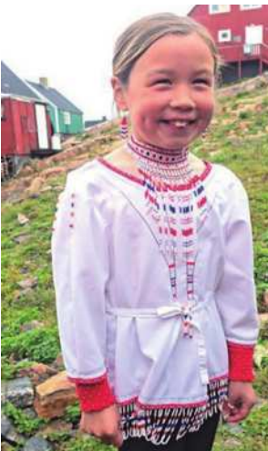
圖25 笑容甜美的小姑娘。