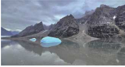
圖8 斯科斯比峽灣變幻萬千的冰山。