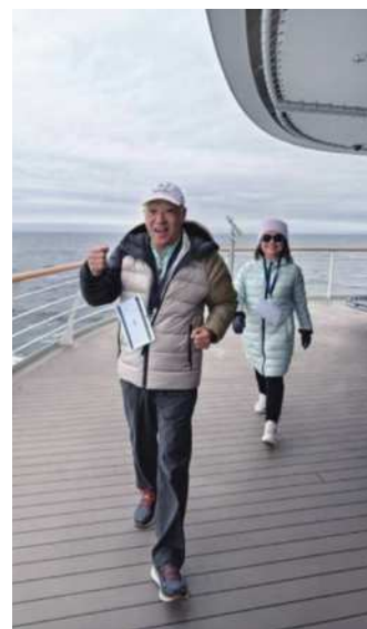
圖6 船上的極地馬拉松競賽。