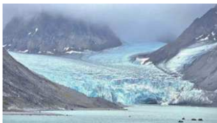
圖2 瑪格達蓮妮峽灣壯觀的冰川。