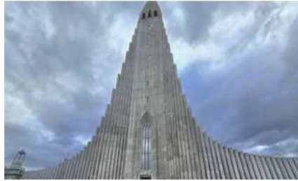
圖32 哈爾格林姆教堂。