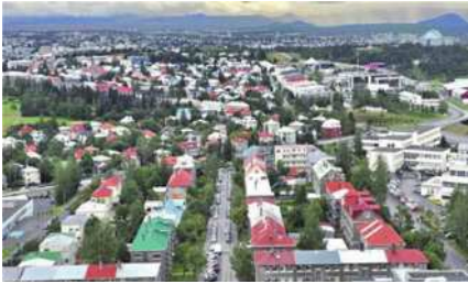
圖31 眺望雷克雅維克市景。