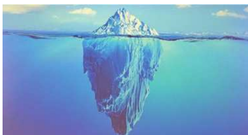
圖5 冰山一角。

來自海水淡化，重要的是廢棄物的處理方式，以號稱最進步最環保的夏古號來講，我們所丟棄的廢棄物全部分類壓縮保存在船艙，等到靠岸港口才將廢棄物拿下船處置。至於廢水有兩套系統處理，如果像洗澡水等較乾淨的，經過廢水回收處理成馬桶的用過的水。如果是馬桶的用水，全部放到儲存槽，一樣到港口靠岸後再處理。