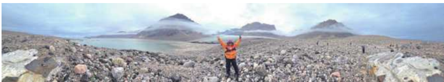
圖21 第二次濕登陸進行極地徒步，夢幻似的環狀雲圍繞山頭，觀望冰川之美。