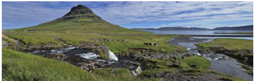
圖36 外形酷似草帽的教堂山。

築物以其獨特的弧形尖頂和側翼而聞名，登上教堂頂眺望360°市景，漂亮之至！之後，我們去體驗飛越冰島(Fly Over Iceland)，這是經由水花、風、霧和氣味等4D效果，鳥瞰冰島的冰川、瀑布、地熱、內陸高地等各種美景，帶來身歷其境的一場飛行，非常震撼！接著來到天空之湖(Sky lagoon)(圖33,34)是2021全新開幕，無邊際海景地熱溫泉，最大的特色就是冰島溫泉儀式「放鬆七部曲」：溫泉、冷水、桑拿、水霧、身體磨砂、蒸氣房、淋浴，完成了這七個步驟，全身有煥然一新的感覺！當然，在雨濛濛中泡湯，來杯冰涼啤酒，那可是其樂無比哦！