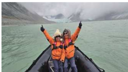
圖1 乘坐衝鋒艇在峽灣內巡航。