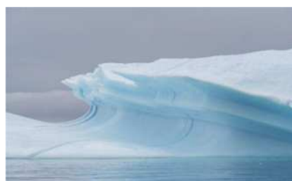
圖19 鬼斧神工的美麗紋路。

盛的一餐！下午四點再次坐上衝鋒艇，作第一次的濕登陸(圖16)，拄著登山杖，費力地攀爬陡峭的山坡，進行極地徒步(圖17)，坡上佈滿了苔原花草，各種罕見的極地小花小草這裡都看得到，欣賞這難得一見北極植被的特有景觀，驚嘆大自然的生命是如此的堅韌！