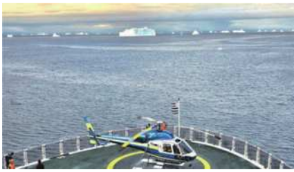
圖11 從甲板上的停機坪欣賞冰山群。