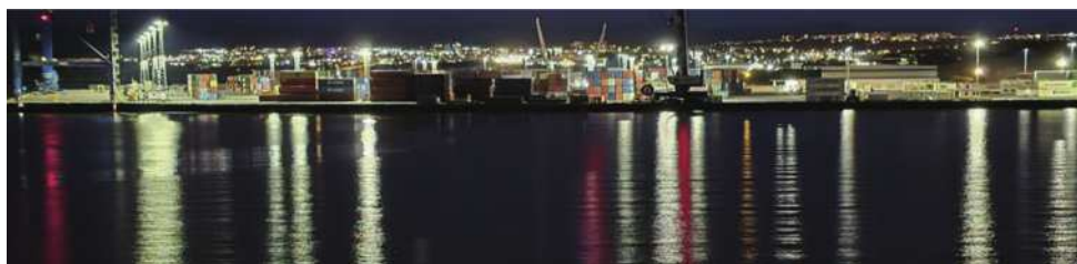
圖30 雷克雅維克港口。

開著四輪機動車載東西，修理屋頂。眼前呈現一棟棟鮮豔繽紛的小木屋，座落在山坡上，非常醒目，真是個漂亮的小村落！