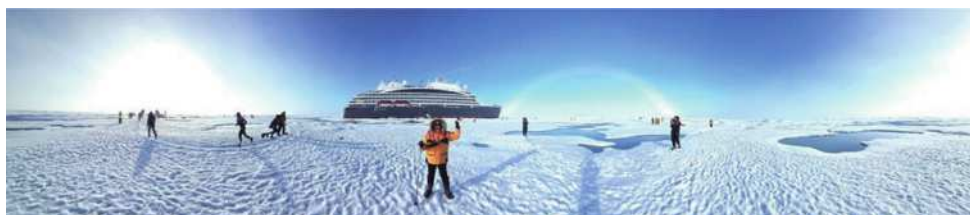
圖29 CHARCOT at 90° N有極地馬拉松、夏古號、彩虹、冰湖，榮獲第二名殊榮。