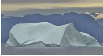
圖9 恰似冰山嘉年華般在眼前掠過。