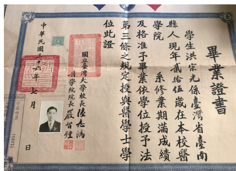
圖3 臺大醫學系畢業證書。

他的同學中，不乏日後臺灣醫界的重要人物，包括前衛生署署長、神經外科權威施純仁醫師，以及高雄醫學院前院長、眼科名醫陳振武醫師。