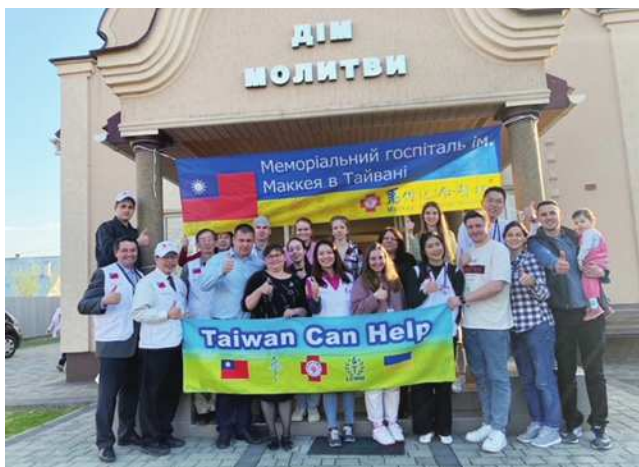
圖2 2023年利用教會場地與關懷對象義診。

輿情分析和接待。我們懷著興奮與忐忑，跨過邊界，進入那片處處隨時可能遭轟炸的土地。