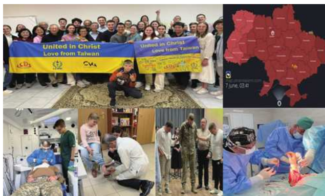
圖4 2024年第二次醫療團。

至在利維夫市設辦公室、派專人Naive駐點、租借倉庫儲存行動牙醫設備。這次，天主教輔大醫院首度加入。自此，在一次次互動長期合作中，在願意半夜驚醒、跳起空襲警報避難、死生與共建立的信賴關係中，醫療團不斷深化服務的內涵。這些故事，譜寫出「Taiwan Can Help」的動人樂章，超越無邦交的政治現實，烏克蘭人常溫暖呼喊：「烏克蘭是台灣的兄弟！」我們同在鄰國威脅下，心手相連，守護自由與民主。