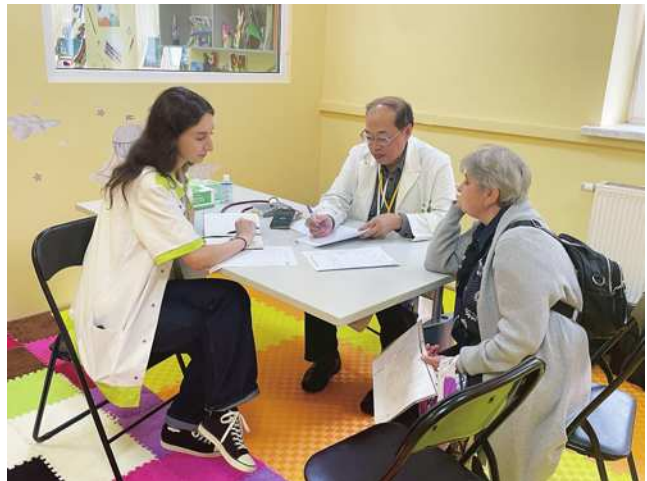
圖6 2025年第三次醫療團義診烏克蘭醫學生翻譯與教學。

2025年9月第三次出團，在我們提議和贊助下，和CMAU在Boryslav合辦因新冠肺炎和戰爭已停辦四年的全烏克蘭基督徒醫療人員