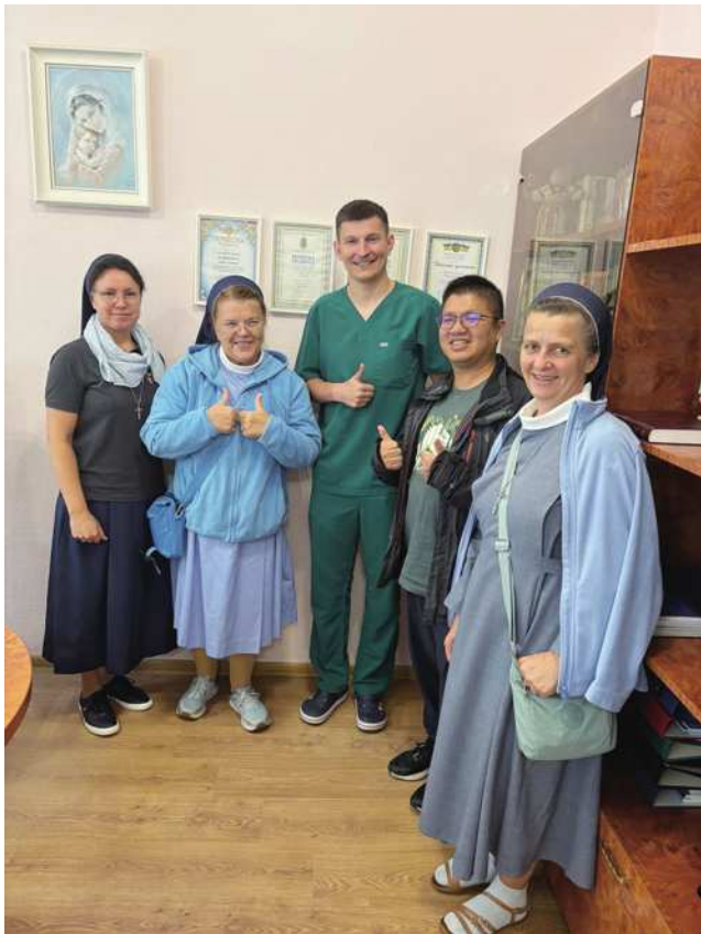
圖8 2025年石台華修女重訪36年前在烏克蘭一起服務的修女。

但梵蒂岡卻與全球十三億天主教教友緊密相連，期盼「Taiwan Can Help」能因此被全球看見。