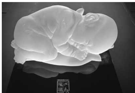
圖17 晶瑩透亮的小嬰兒側睡雕像。

治的病人後，些許外在給予的貼心肯定與鼓勵所內涵的意義與價值，絕不是物件的俗世價格所能相提並論的。這些不起眼的小玩意兒雖已伴我多時，少有光鮮亮麗的耀眼光芒，卻是我生命歷程中難以割捨的珍貴回憶。