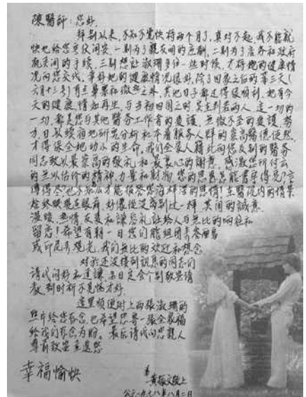
圖3 1978年病人家屬的印尼來信。