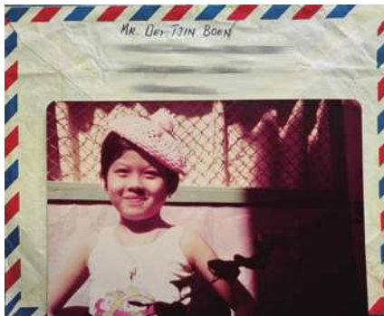
圖5 1978年病童返回印尼後的照片。