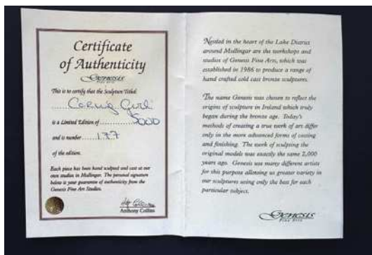
圖16 銅雕手掌的證明。