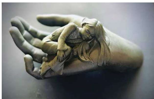
圖15 附有證明的愛爾蘭銅雕手掌。