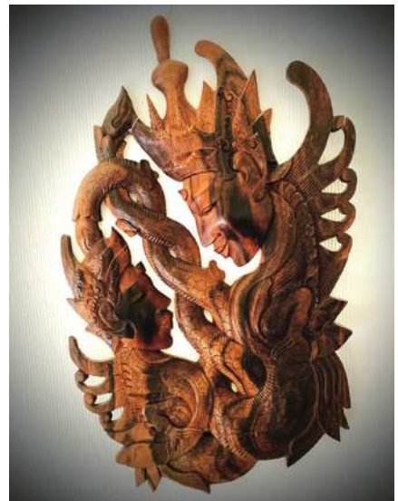
圖6 具有印尼傳統風格的精美木刻。

會，科部內所有各次專科的教授和醫師們都出席參與討論。令人印象深刻的是有位教授語意深長的提及，病童被家屬不辭艱辛地專程遠渡重洋，慕名護送病童前來求醫，兒科總得有所交代吧！顯見遍尋病因的難度確是非比尋常。