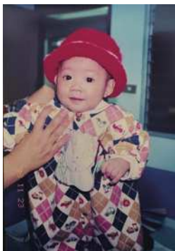
圖7 露茜寶寶週歲生日照。