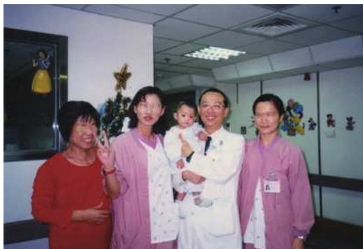
圖8 露茜寶寶週歲生日病房中的合照。