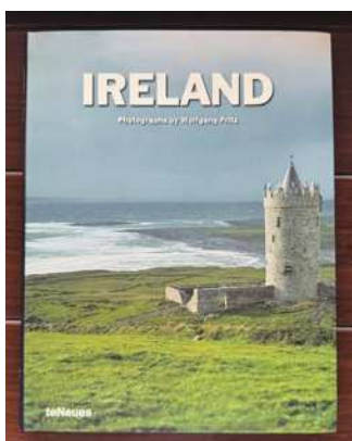
圖13 介紹愛爾蘭的畫冊。