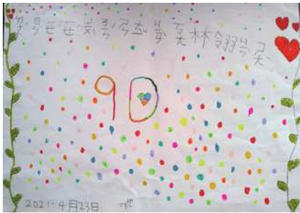
圖1 一張珍稀可貴的圖畫。