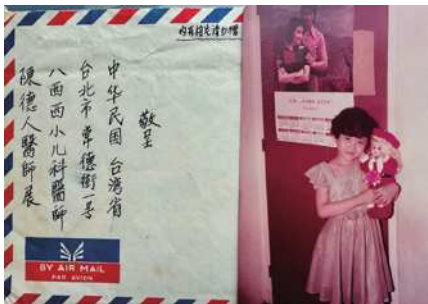
圖4 1978年病人家屬的印尼來信和照片。