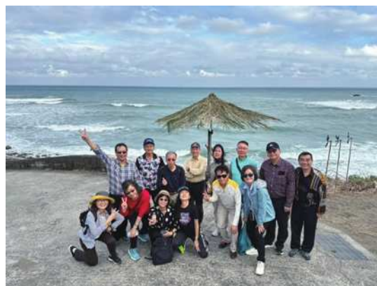
圖1 台東往大海的路。

班上同學策劃的長濱旅遊行程如下，113年12月7日，搭乘415自強號7：37高雄出發，新自強號上心情愉快作了一首詩，「晴空萬里艷陽照、田園大海伴我行、火車已過太麻里、期待騎乘樂逍遙」，10：34抵達玉里(圖2)，久不