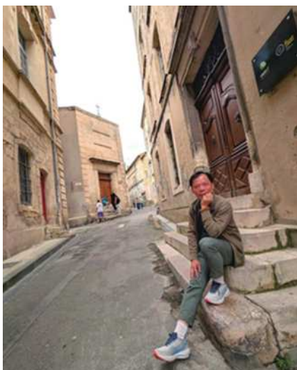
圖23 斑駁痕跡的千年建築物之間的街道。