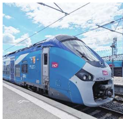
圖3 轉搭區間車到Avignon centre。