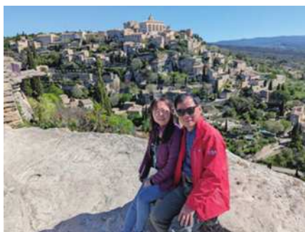
圖11 天空之城，戈爾德。