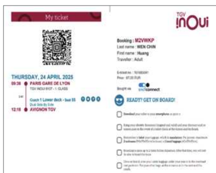
圖1 Apple Pay上SNCF買到的票。