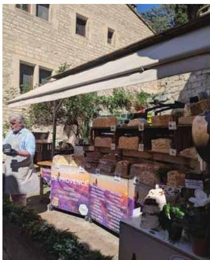
圖14 中世紀村莊萊博村好吃超甜的餅。