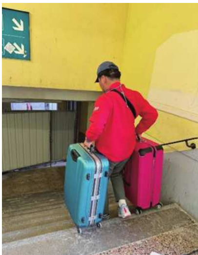
圖17 在亞爾車站，提著兩大行李走。