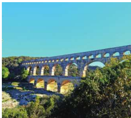
圖16 加爾橋，這是羅馬時期保存最完好的水道。

的湧泉至今仍未揭示其奧秘，許多洞穴學家無法確定其井的確切深度。我們就在河邊找個地方坐下來，吃自己準備的法國麵包午餐，一邊看著碧綠溪流緩緩流過，一邊聽著水聲與鳥鳴，那種寧靜療癒的感覺，是城市裡很少能感受到的。