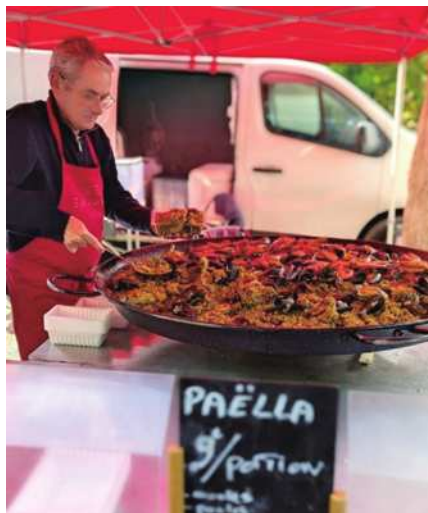
圖21 亞爾市集現場做的海鮮燉飯。