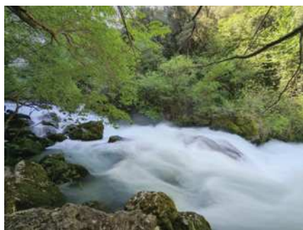
圖12 碧泉村的索爾格河的發源地。