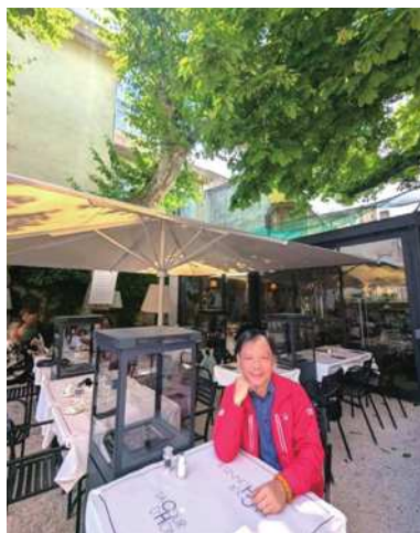
圖5 La Cour d'Honneur餐廳。