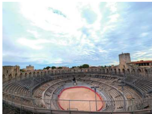
圖28 從塔樓制高點俯瞰整個競技場全景。