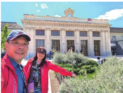
圖4 Avignon centre。