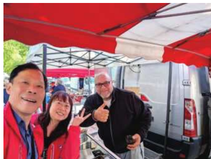
圖22 亞爾市集賣餡餅的老闆。