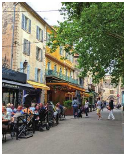
圖25 《星空下的咖啡座》。