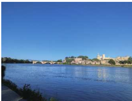
圖8 隆河聖貝內澤亞維儂斷橋。