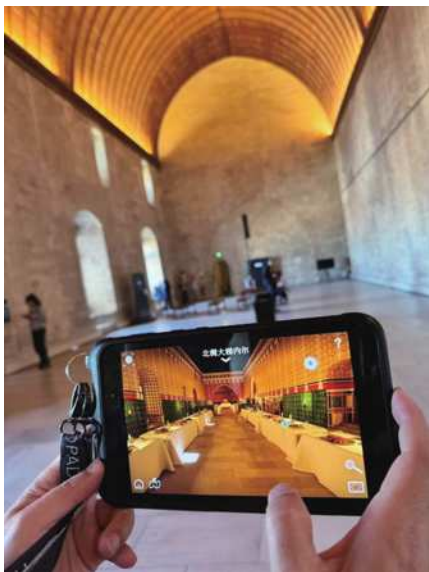
圖7 彷彿回到1352年英諾森特教皇登基的場景。