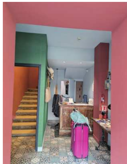
圖19 這飯店連大門及大廳都沒有。

若不放心，也可以主動再問導遊，聽不懂導覽內容頂多聽一些歷史，但若聽錯集合時間地點，就有可能真的被放鳥在山城裡。