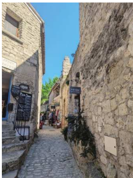
圖13 中世紀村莊萊博村。