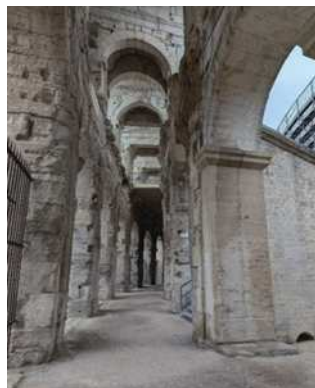
圖27 亞爾競技場的如迷宮走道。