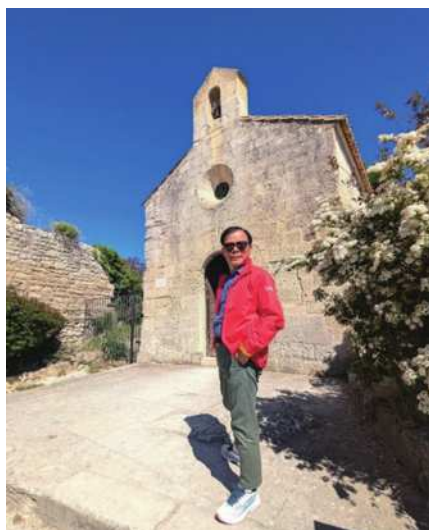
圖15 16世紀房屋以及羅馬風格的聖文森教堂。