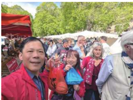
圖20 亞爾市集現場買的戰果。