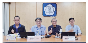
圖12 115年4月23日本會召開「第14屆第2次老人醫療與長照專案小組會議」