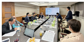
圖6 115年4月8日本會召開「第14屆第6次編審審稿會議」