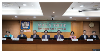
圖10 115年4月22日本會召開「『健康台灣深耕計畫』醫師公會體系標竿分享會議(第二場)」