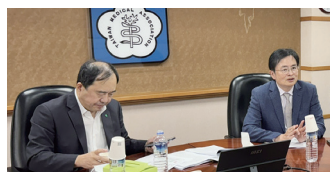
圖11 115年4月22日本會召開「第14屆第2次醫院醫療委員會」