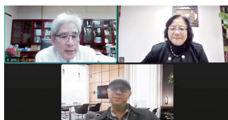
圖2 115年3月27日本會舉辦醫療安全暨品質研討會《143》醫療器材風險管理與責任歸屬