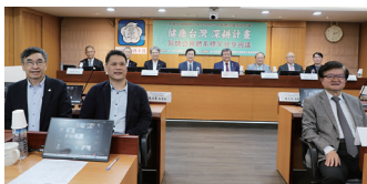
圖5 115年4月8日本會召開「『健康台灣深耕計畫』醫師公會體系標竿分享會議(第一場)」