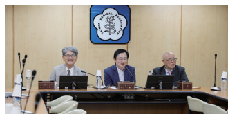
圖7 115年4月9日本會召開「第14屆第2次醫學倫理暨紀律委員會」