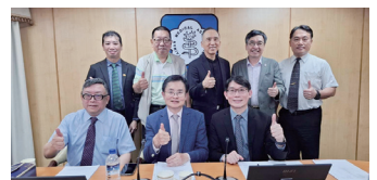
圖8 115年4月21日本會召開「第14屆第2次公關委員會」